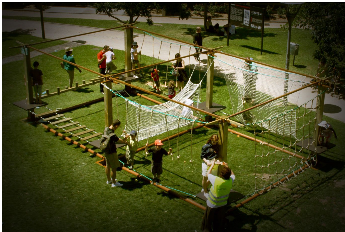
Structure « Urban Kid » 3-8 ans