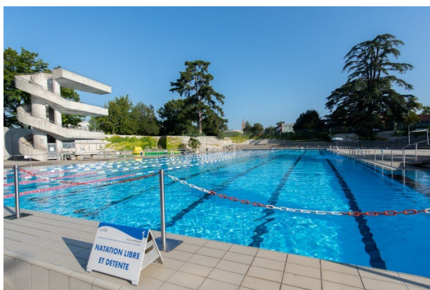
Bassin olympique de la piscine de Marignac

Bassin olympique, bassin non-nageurs, pataugeoire et bassin du plongeur