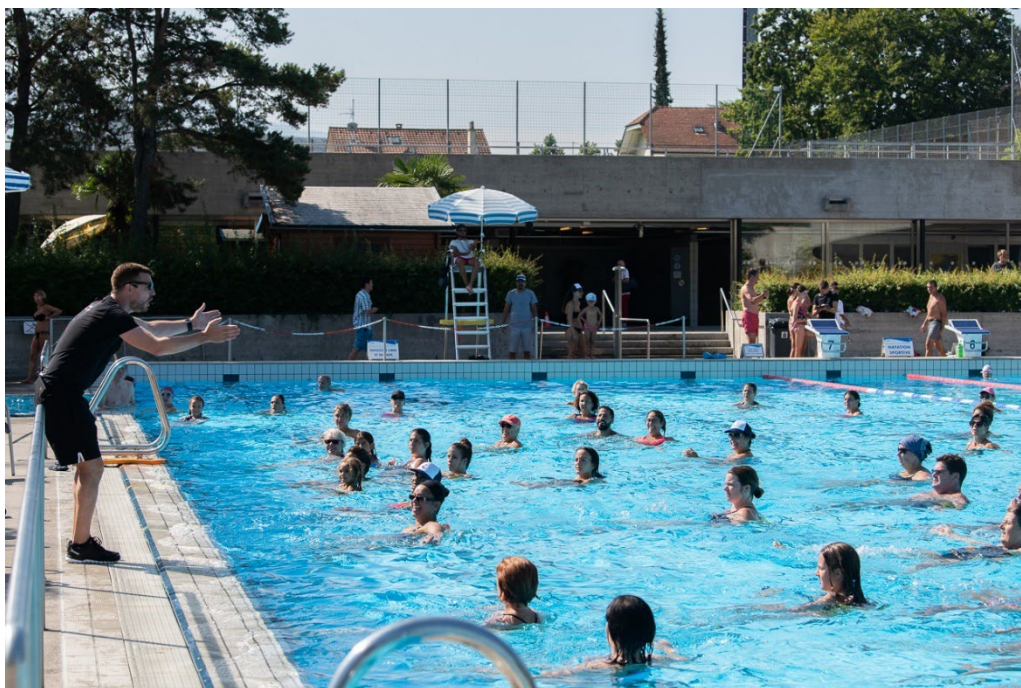
Bassin olympique de la piscine de Marignac