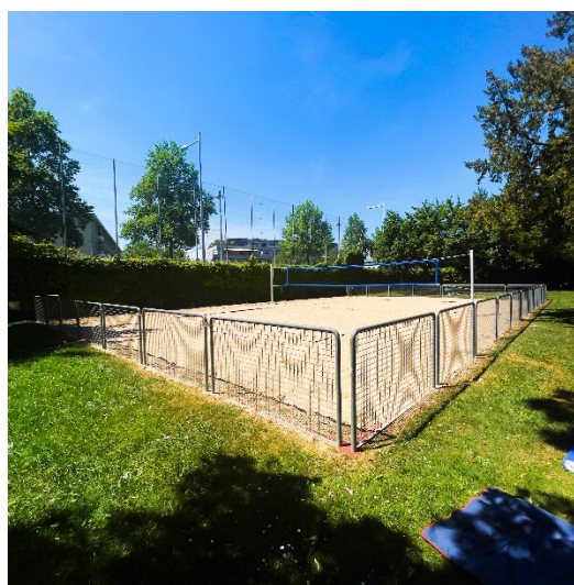
Zones de sport sur sable : barres fixes/workout, terrains de beach soccer et beach volley