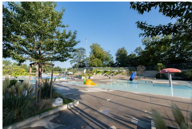
Pataugeoire de la piscine de Marignac