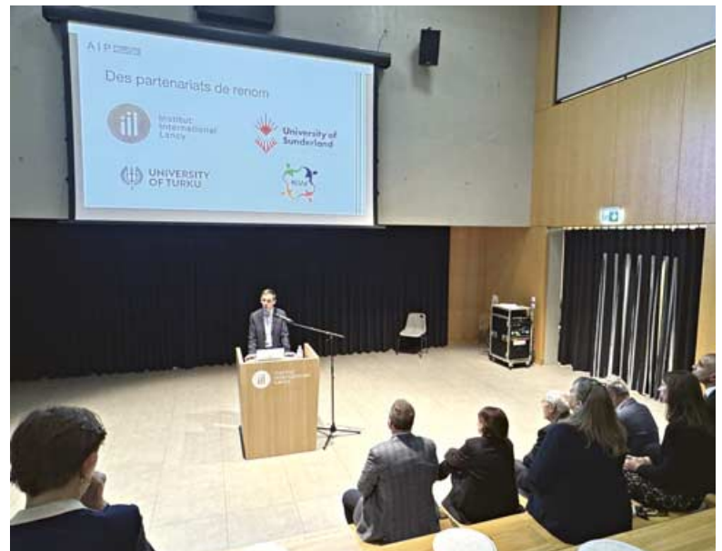
Active depuis fin 2024, la Fondation Académie pour l'Innovation Pédagogique (AIP) a été officiellement lancée dans les murs de l'Institut International de Lancy (IIL) qui participe pleinement à cette belle aventure. Pour l'AIP, le partage du savoir et l'éducation des enfants font partie de son ADN. Cependant, ces valeurs sont également partagées avec les adultes, leur permettant d'accéder à des formations valorisantes avec l'octroi de certifications internationales reconnues, délivrées par l'Université de Sunderland. La lutte contre le harcèlement en milieu scolaire est également au cœur des préoccupations à travers le programme KIVA dont IIL est une utilisatrice pionnière en Suisse.