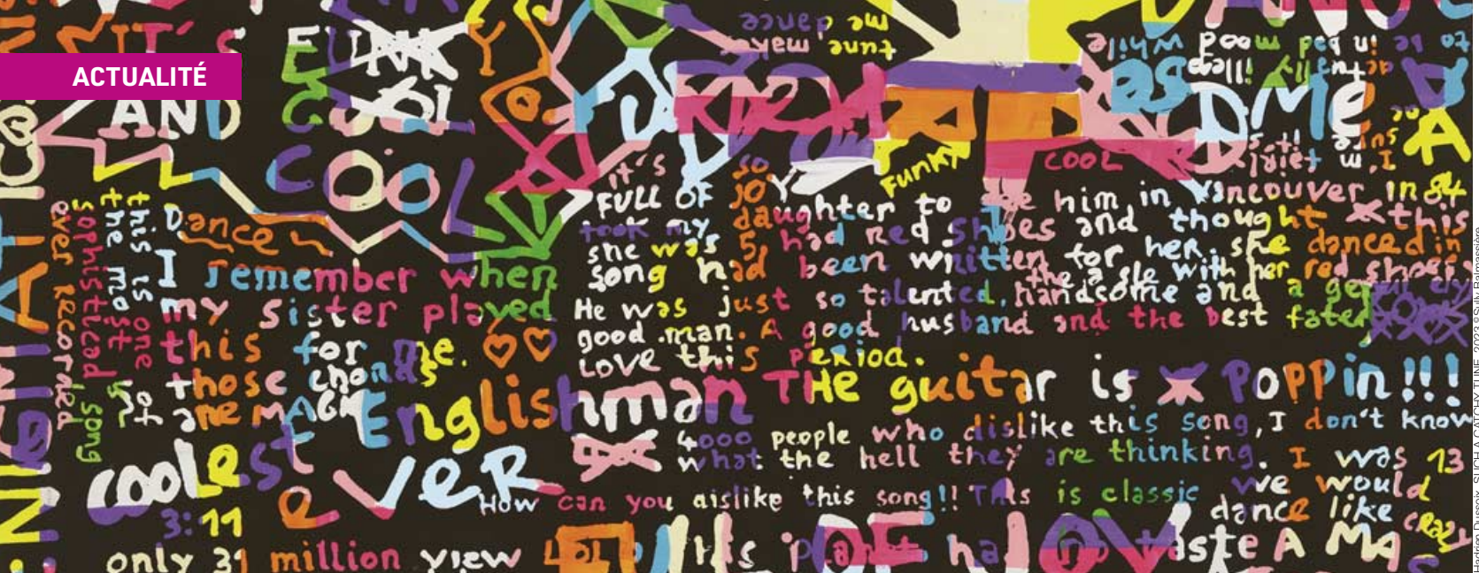
Hadrien Dussoix, SUCH A CATCHY TUNE, 2023