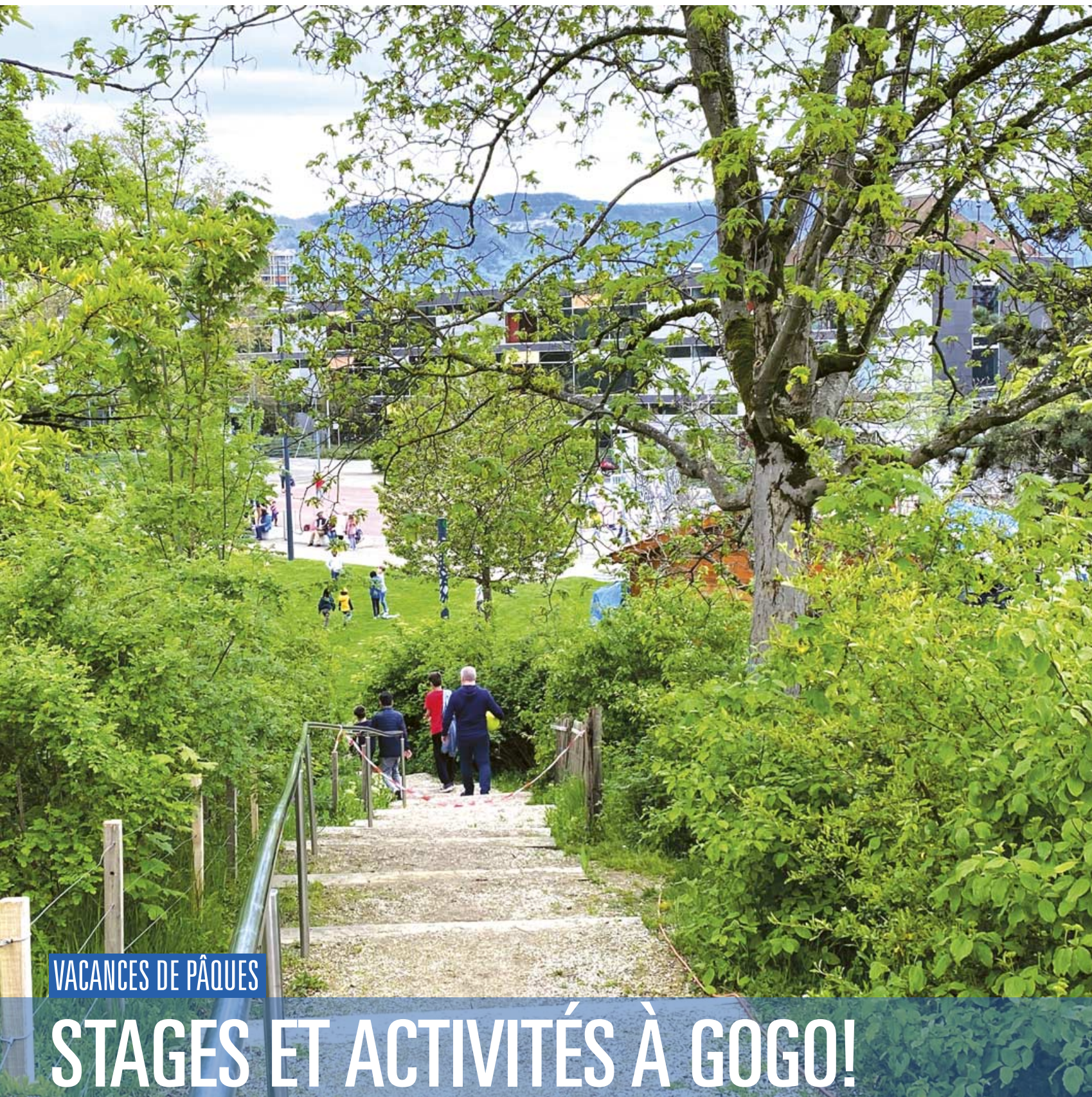
Au Parc Bertrand (Petit-Lancy)