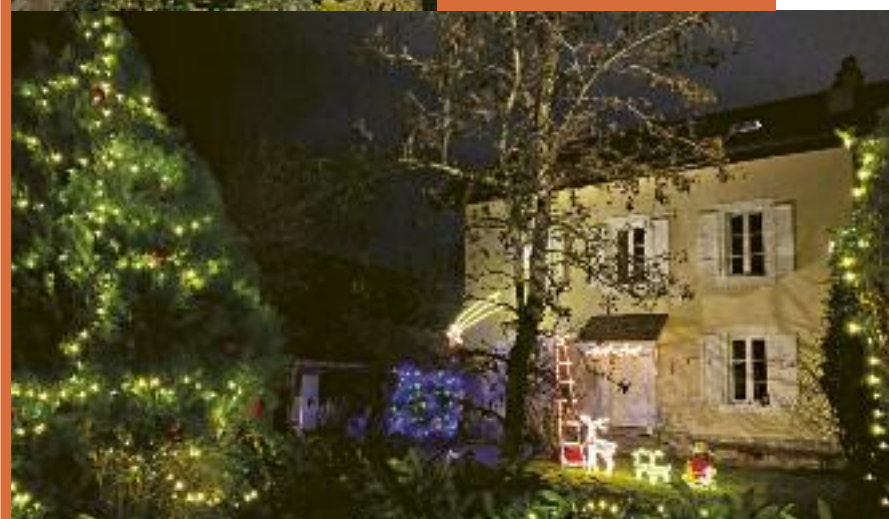
Non loin de là, les enfants ont pu rêver devant la voiture du Père Noël remplie de cadeaux.