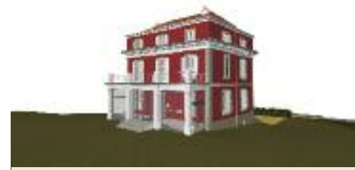
GGB architectes SA