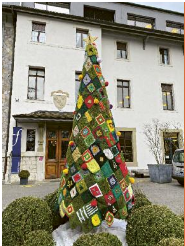
En ces fêtes de fin d'année si particulières, l'Institut Florimont a opté pour un sapin de Noël participatif "fait maison", composé d'une multitude de losanges tricotés, aux motifs variés multicolores.

Distribution de cadeaux aux Aîné.e.s 12/20