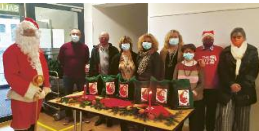
Les traditionnelles fêtes de Noël organisées par les Associations d'Intérêts de Lancy n'ont pas pu avoir lieu. Qu'à cela ne tienne! Au Petit-Lancy, les bénévoles des Intérêts ont tenu à offrir un présent à leurs aîné.e.s et se sont mobilisés pour les recevoir à la Salle communale du Petit-Lancy, tout en leur garantissant un accueil sécurisant, répondant strictement aux consignes de sécurité en vigueur. Ce sont ces petits gestes qui peuvent faire la différence pour tous ceux et celles qui sont plus isolé.e.s que jamais en raison de la pandémie.

Distribution de cadeaux aux Aîné.e.s 12/20