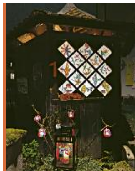
Si les conditions actuelles ne permettaient pas d'organiser des marchés de Noël ou de grands rassemblements en famille ou entre amis, les Lancéen.ne.s ont mis tout leur coeur dans les décorations de leurs balcons, de leurs maisons et de leurs jardins.

Les Lancéen.ne.s décoorent leurs maisons 01 au 24/12/20