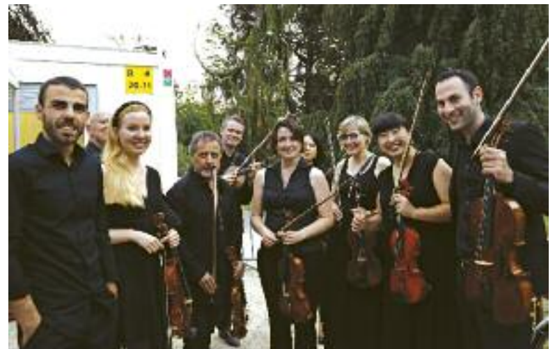
Cet été, c'est concert! Orchestre de Lancy-Genève, Jardin Botanique Genève, 10 juillet 2020