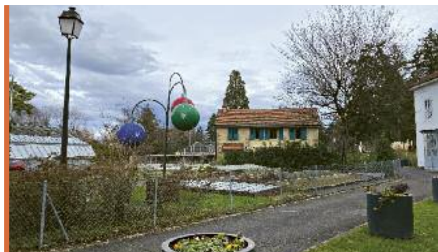
Le Service de l'Environnement a également contribué à égayer ces fêtes de fin d'année moroses à travers des décorations originales ornant les parcs, les giratoires et les places de notre commune, comme ici au Parc Chuit.

Retrouvez plus de photos sur www.facebook.com/lelanceen et sur Instagram!