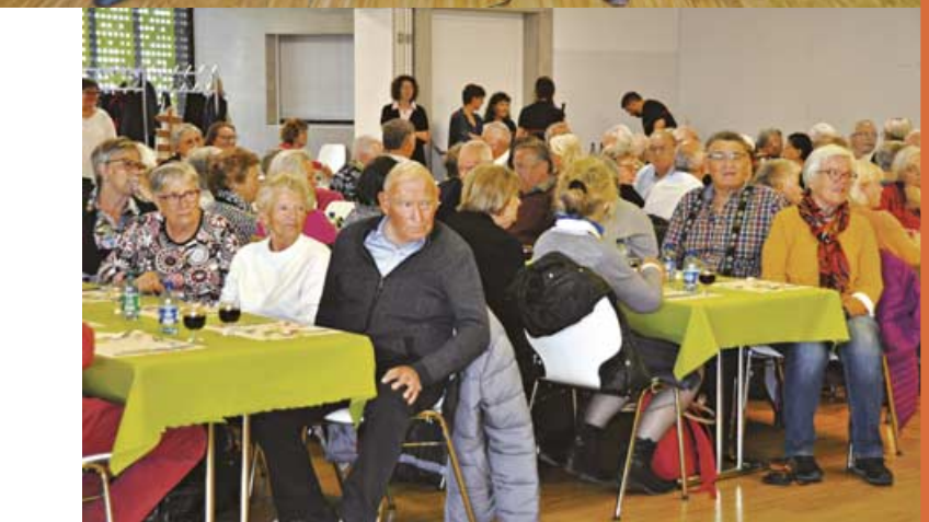
Comme chaque année, les bénévoles des Associations d'Intérêts de Lancy ont convié les aînés lancéens à fêter l'arrivée du printemps autour d'un délicieux repas.