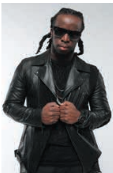
L'excellent rappeur français Youssoupha assurera une soirée de clôture en apothéose, le dimanche 10 juillet à 20h.