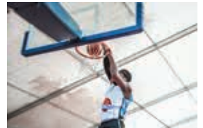
Concours de dunks