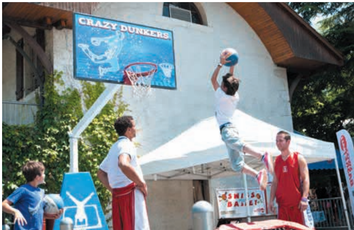
Les Crazy Dunkers sont de retour cette année pour un spectacle sur le thème des super héros et du feu. Tout au long du week-end, ils initient au village OPENAIRE le public à l'art du dunk sur trampoline.

athlètes d'Ebene de Légende Doubledutch, qui mêlent chorégraphies et acrobaties sur une double corde à sauter.