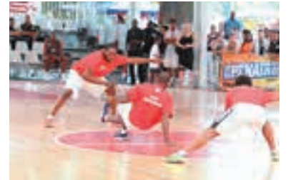
Ebene de Légende Doubledutch