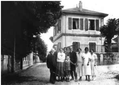
Archives de la Ville de Lancy

Date: ? - Lieu: Grand-Lancy - Adresse: ? - Qui: ?