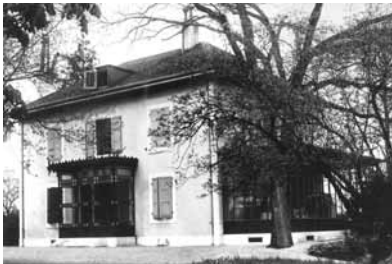
Archives de la Ville de Lancy

Date: ? - Lieu: Petit-Lancy - Adresse: ? - Qui: ?