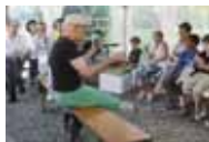
Villa Bernasconi Du mercredi 26 au vendredi 28 octobre de 14h à 18h

C'est le dernier moment pour s'inscrire à l'atelier enfant des vacances d'automne!