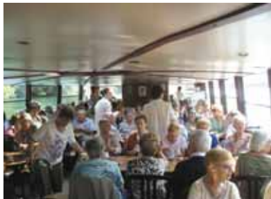
Participants sur le bateau

tout son cœur nous fit aimer cette montagne.