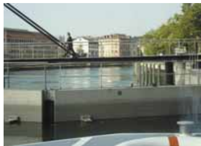
Ecluse du Seujet