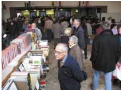
Salle communale du Petit-Lancy, 5-6 novembre 2011

Le rendez-vous annuel des amateurs de livres anciens poursuit son voyage à travers le monde avec sa neuvième édition consacrée à la Russie. Comme il se doit, en plus de la littérature, ce sont les traditions culturelles, artistiques, artisanales et gastronomiques de Russie qui composent le riche programme de ces journées.