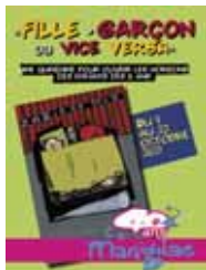
Une quinzaine pour ouvrir les horizons des enfants dès 6 ans

Pour l'année des 40 ans du Centre Marignac, nous avons décidé d'aborder un thème qui répond à l'objectif du "bien vivre ensemble", celui des relations filles – garçons.