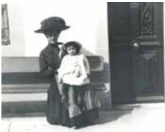
Archives de la Ville de Lancy