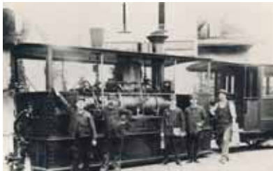
Un tram à vapeur devant le Café-Brasserie Suisse et l'Auberge des Communes-Réunies, dans le village du Grand-Lancy.

Nous préparons activement l'exposition qui aura lieu à la Grange Navazza (Petit-Lancy) du 1 er au 16 octobre 2011 (vernissage: le 30.09.2011), sur les thèmes "Vie praisoiale – transports autrefois". A