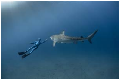
Le ballet subaquatique entre un requin-tigre femelle de près de 4 mètres de long et William Winram

Plus d'information sur: http://www.oceanencounters.net http://williamwinram.com http://nekto.net