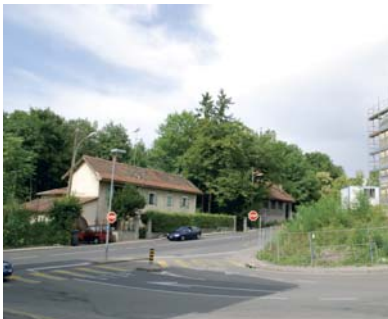
Villa du Point-Virgule - 96 rte du Grand-Lancy