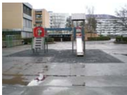
État actuel du préau