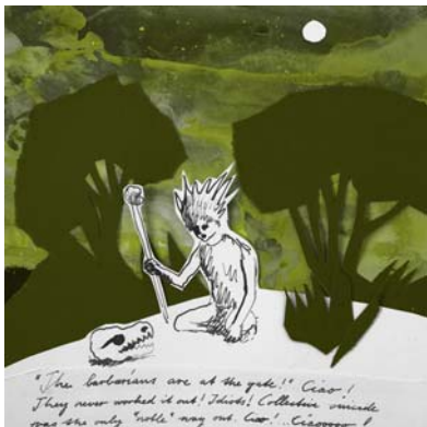
Mathias Schauwecker, Way out, technique mixte. Tiré du livre «Jardin» 2009

Villa Bernasconi 8 route du Grand-Lancy - 1212 Grand-Lancy T 022 794 73 03 Tiam 15 arr t Mairie Train et tram 17 arr t Pont-Roug Parking de l'Étoile www.villabernasconi.ch