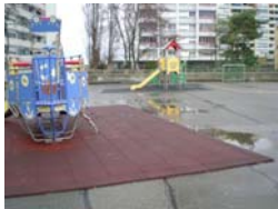
Préau de l'école du Bachet